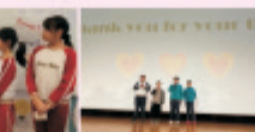
Our 6E2 students are introducing and describing their best friend.