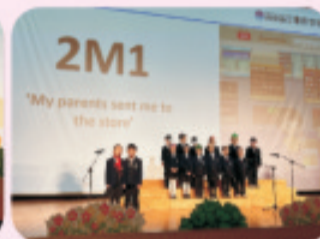
2M1 entertained us with their poem "My parents sent me to the store".