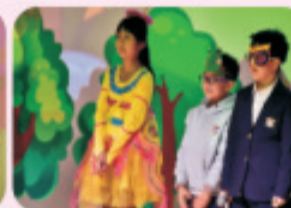
The grade 3 students all presented a class drama. They ranged from the Three Little Pigs to Do- Re-Mi. The students helped to create their own props and costumes for the performance in class.