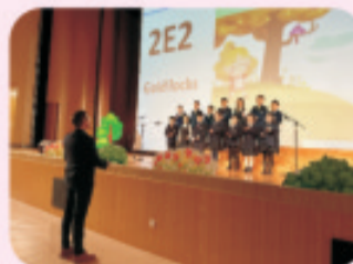
Here we can see our 2E2 class reciting Goldilocks on stage.