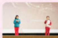
Here are some of our 6A2 students talking about technology and how it can change our lives.