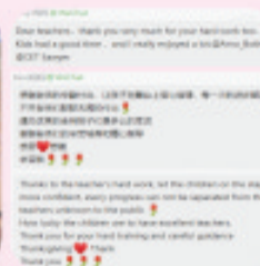
We received some wonderful feedback from parents as well.