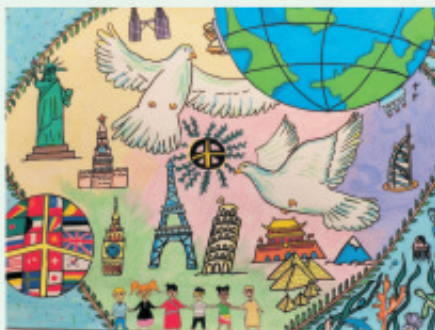
学生姓名: 刘如康 作品介绍: 左边是天空，右边是海洋，中间各国的建筑代表着，这里是地球村，地球村里有不同肤色的小朋友手拉手，代表着各国小朋友的友谊和爱，和平鸽代表对世界和平的期望，期待世界没有战争。