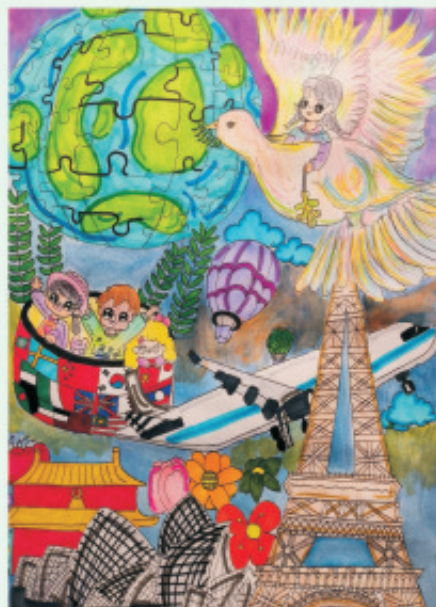
学生姓名: 郭思羽 作品介绍: 地球就是张大拼图，当象征着和平的白鸽带着小朋友将最后一块拼图拼于地球之中，所有国家版图将手拉着手，心连着心，化身成一个巨大的热气球，带着世界各地的小朋友环游世界。