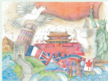
学生姓名: 张晓然 作品介绍: 和平的是和平、友谊、团结的象征，在和平的“呼唤和平”的歌声里，世界各国都在为世界和平贡献自己的力量。