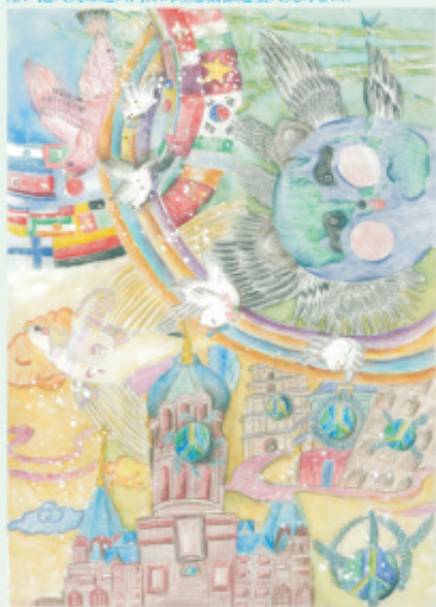
学生姓名: 赵倩一 作品介绍: 国旗，代表世界各国团结友爱，捧着地球，代表人们对美好生活的向往。彩虹，代表幸福与甜美。和平鸽，和平标志，橄榄枝和世界各地标志性建筑，则代表世界和平。