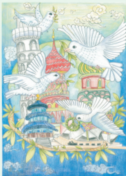
学生姓名: 郭真好 作品介绍: 和平的嘴里衔着代表自由和平的橄榄枝，与人类一起共筑我们的地球家园。蔚蓝的海洋，绿色的大地，我梦想世界和平，人类幸福，让快乐开遍大江南北！