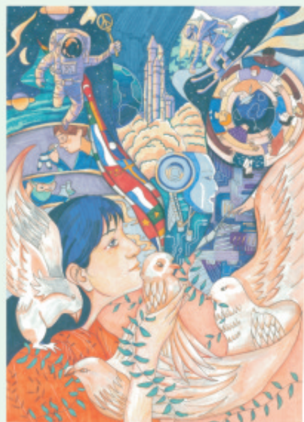
学生姓名: 邵芝沂 作品介绍: 被和平鸽环绕的小女孩，像是插上了梦想的翅膀，展开了一系列对未来的想象，全世界人民一起从科技、航空、医疗等各方面共同参与。