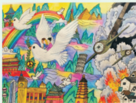
学生姓名: 张代哲天 作品介绍: 中国是一个多彩和平的国度，这里的小朋友都有着幸福的童年，但在世界的某些角落，仍然充斥着战争、病痛和饥饿。我叫石磨，我穿着汉服骑着和平的，来到战火纷飞乌克兰，来到疾病横行的非洲部落，来到深陷灾难的叙利亚。载着那里的小朋友逃离苦海，飞向他们向往已久的和平生活！我要努力长大，把中国热爱和平、追求和平的愿望传播到世界每个角落，把人类命运共同体理念播撒进全人类的心田。